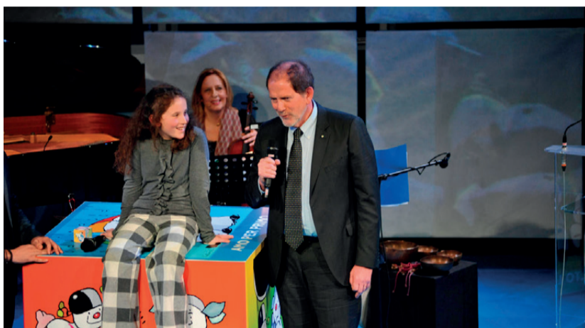
Tre momenti dei 40 anni del Centro Mariapoli. L'inaugurazione con Chiara Lubich alla presenza dell'arcivescovo Alessandro Maria Gottardi, il mini Sinodo della Chiesa trentina nel 2014 e un incontro dei ragazzi col sindaco Pacher.

compagne, Eli Folonari e Gis Calliari, al microfono il primo focolarino sacerdote don Marco Tecilla, accolto dal parroco di Cadine don Raffaele Poletti, con la promessa di “essergli di aiuto da buoni parrocchiani”. Quel giorno, aperto anche alle autorità politiche che avevano favorito questa sorta di “ritorno” nella città culla del Movimento, sentimmo che il rapporto fra Trento e il carisma focolarino sarebbe stato più stretto e fecondo: “Questo Centro ci ricorderà la rivoluzione evangelica che la Parola scatena ogniqualvolta la si mette in pratica con impegno - fu l'impegno espresso da Lubich nel suo applaudito e lungo intervento - ;