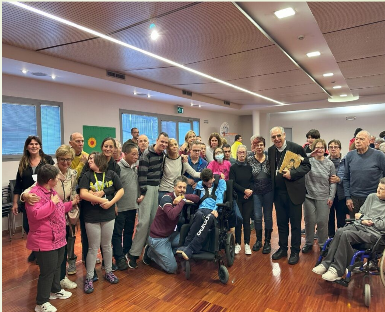
Grazie alla vita (Mezzolombardo)