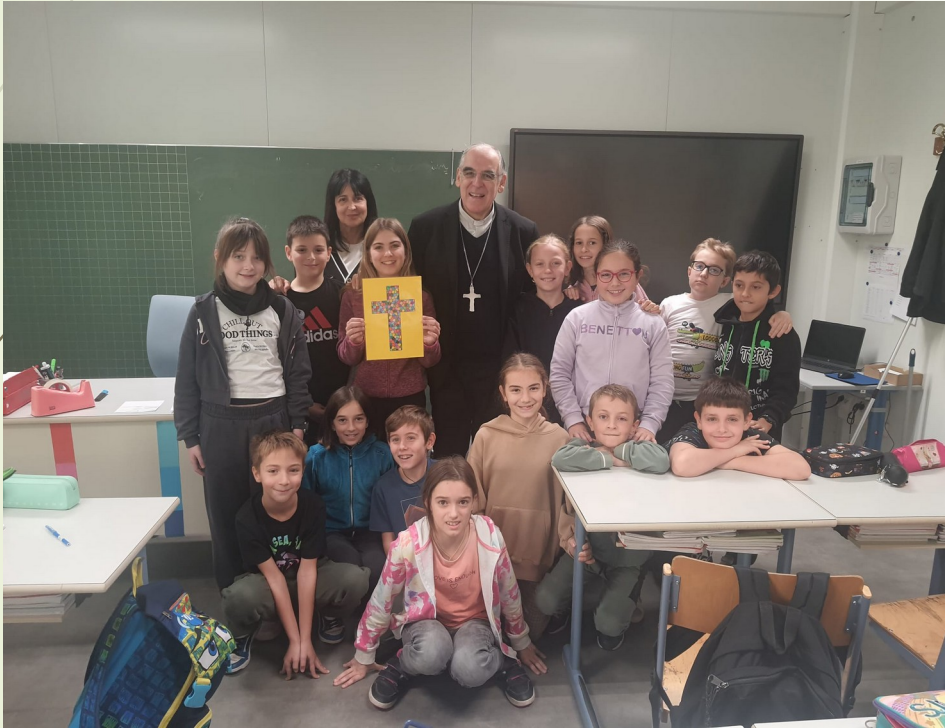
Scuola primaria di Mezzocorona