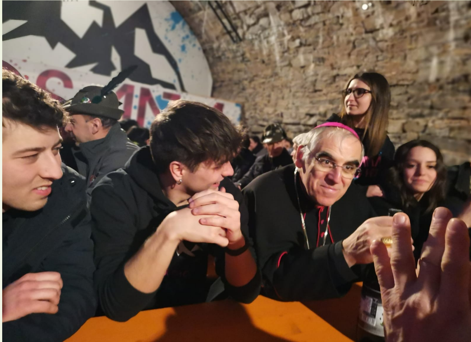
Con i giovani di Mosana