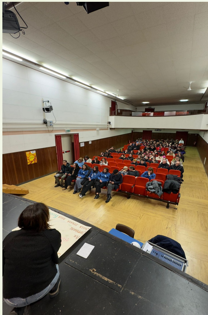
Oratorio di Mezzocorona