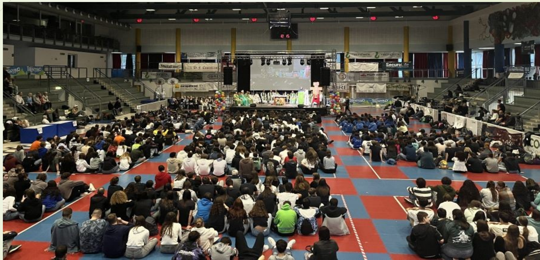
Festa degli adolescenti Lavis