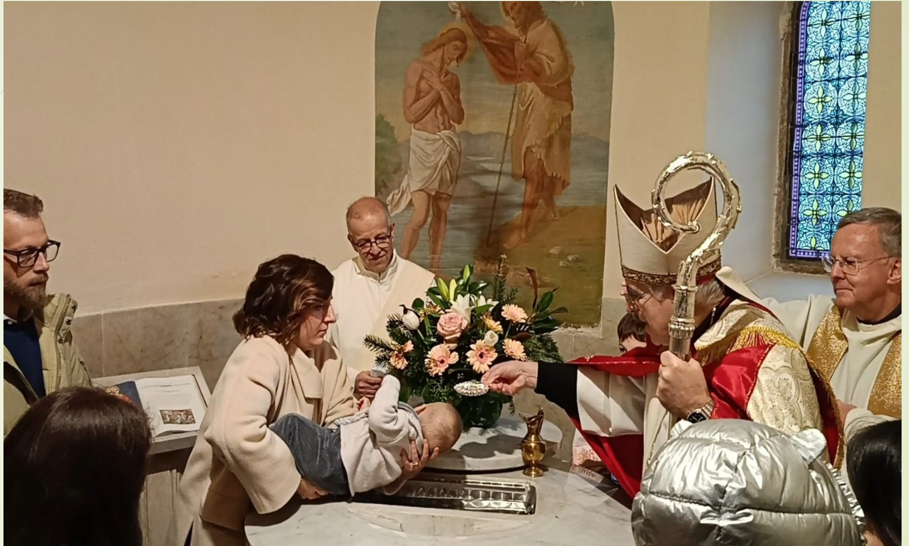
Battesimo a Mezzocorona