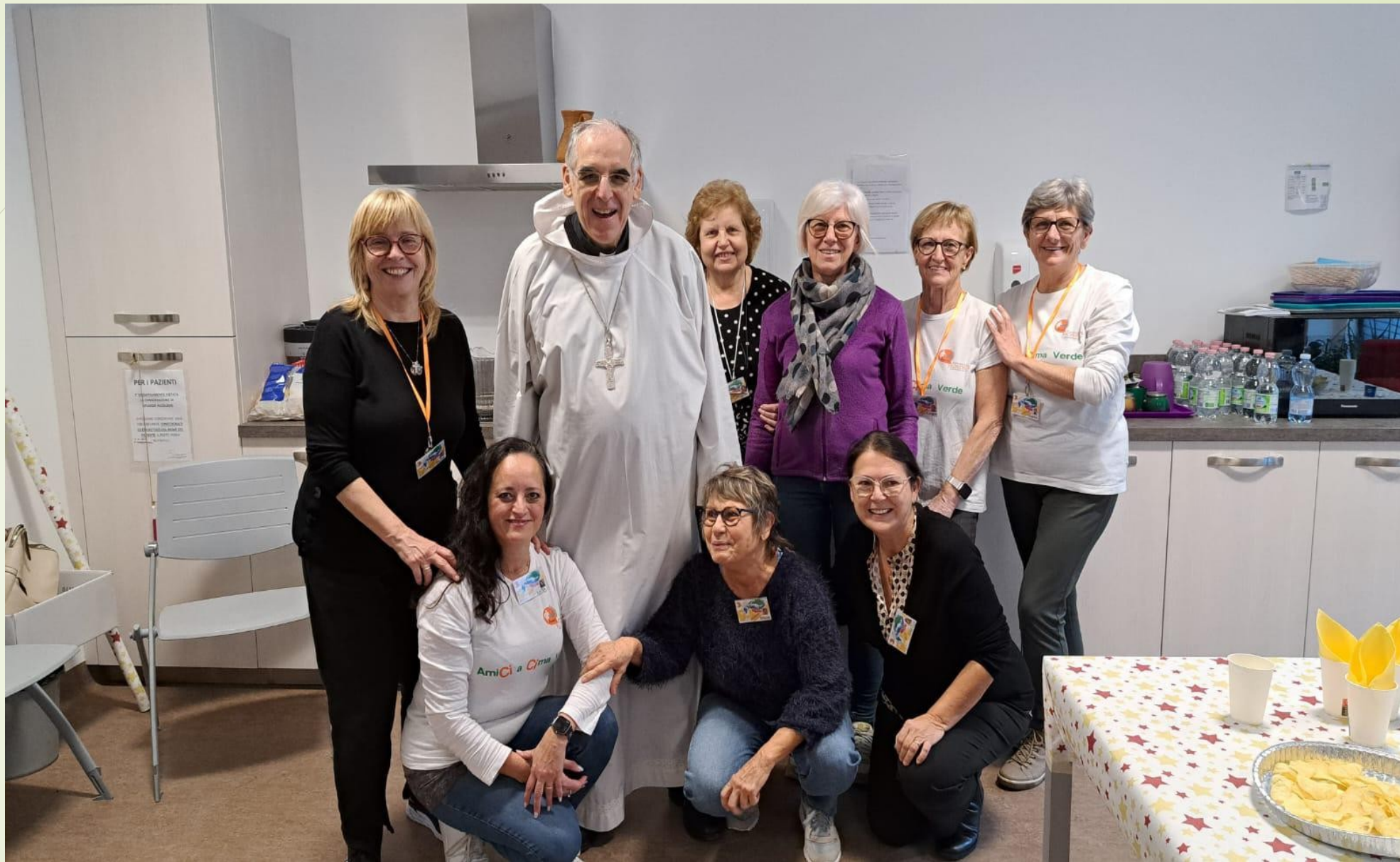
Hospice di Mezzolombardo