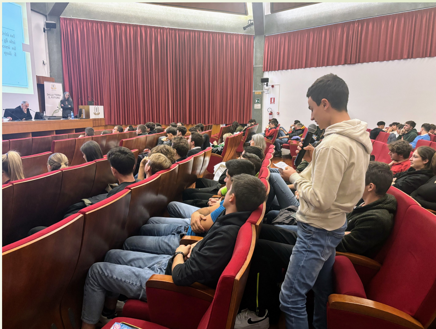
Incontro con gli studenti dell'Istituto agrario di S.Michele all'Adige