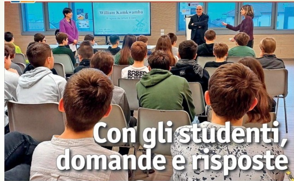
Scuola secondaria di primo grado a Mezzolombardo