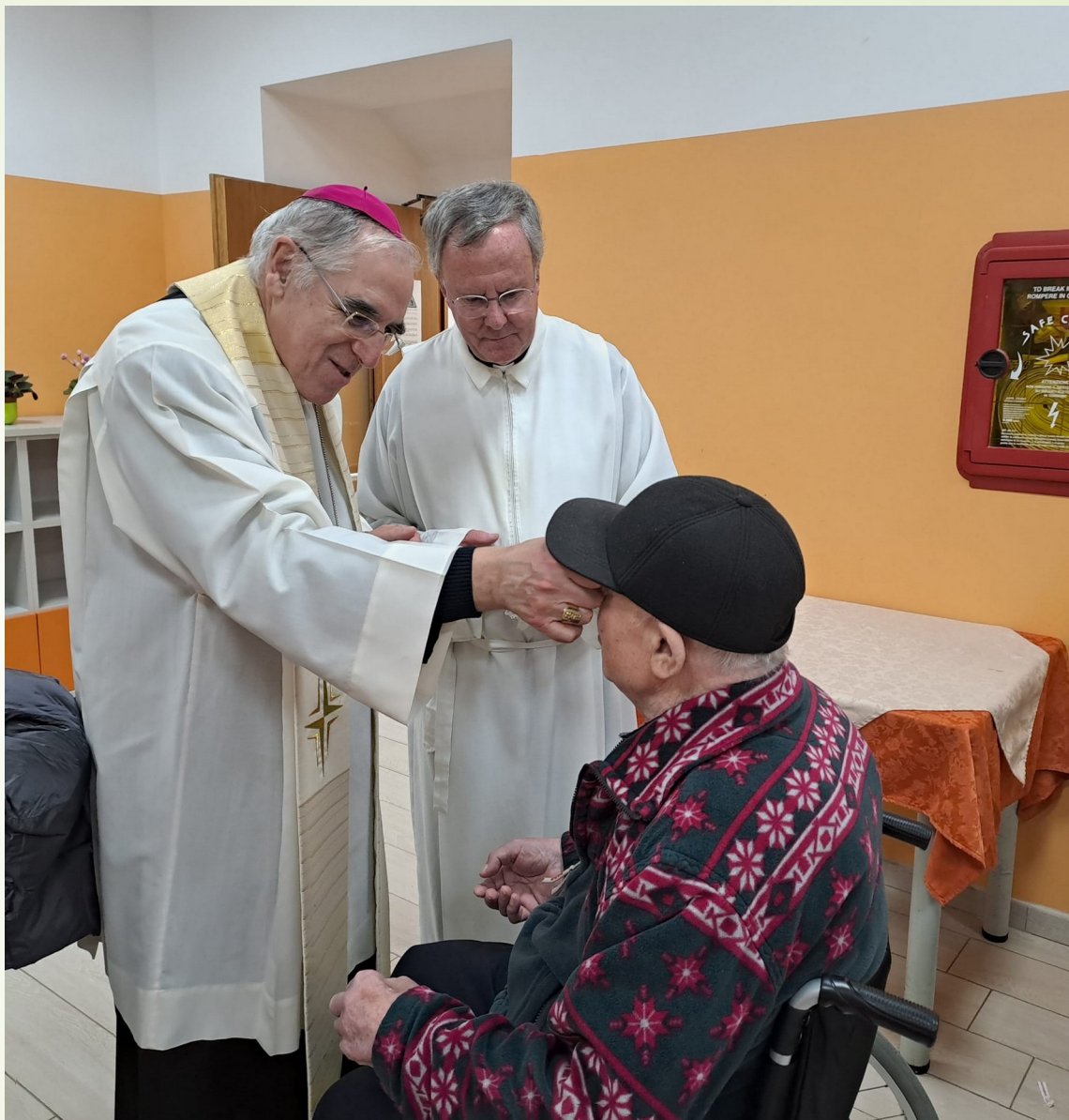
RSA di Mezzocorona