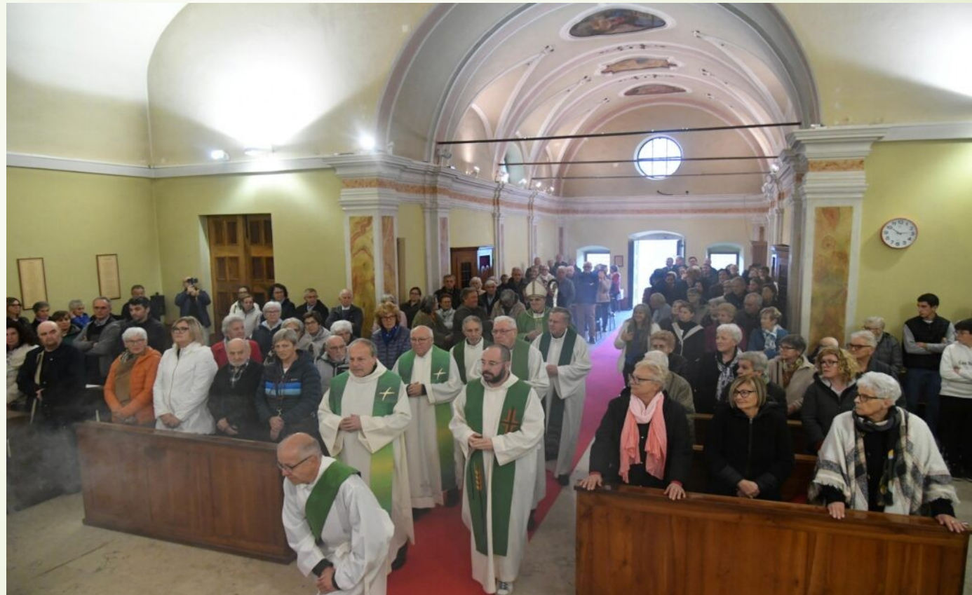
Messa di inizio Visita pastorale a Segonzano, 12 ottobre 2024

“Siamo comunità, chiamate a camminare insieme, a passare da una Chiesa non “mia” ma “nostra”, a formare comunità forse meno numerose ma più aperte e accoglienti nel cuore e nella mentalità.”