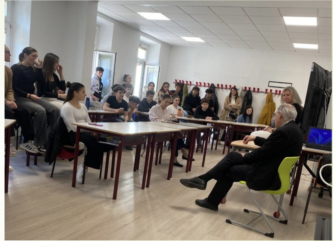
Con gli studenti dell'Istituto Martini