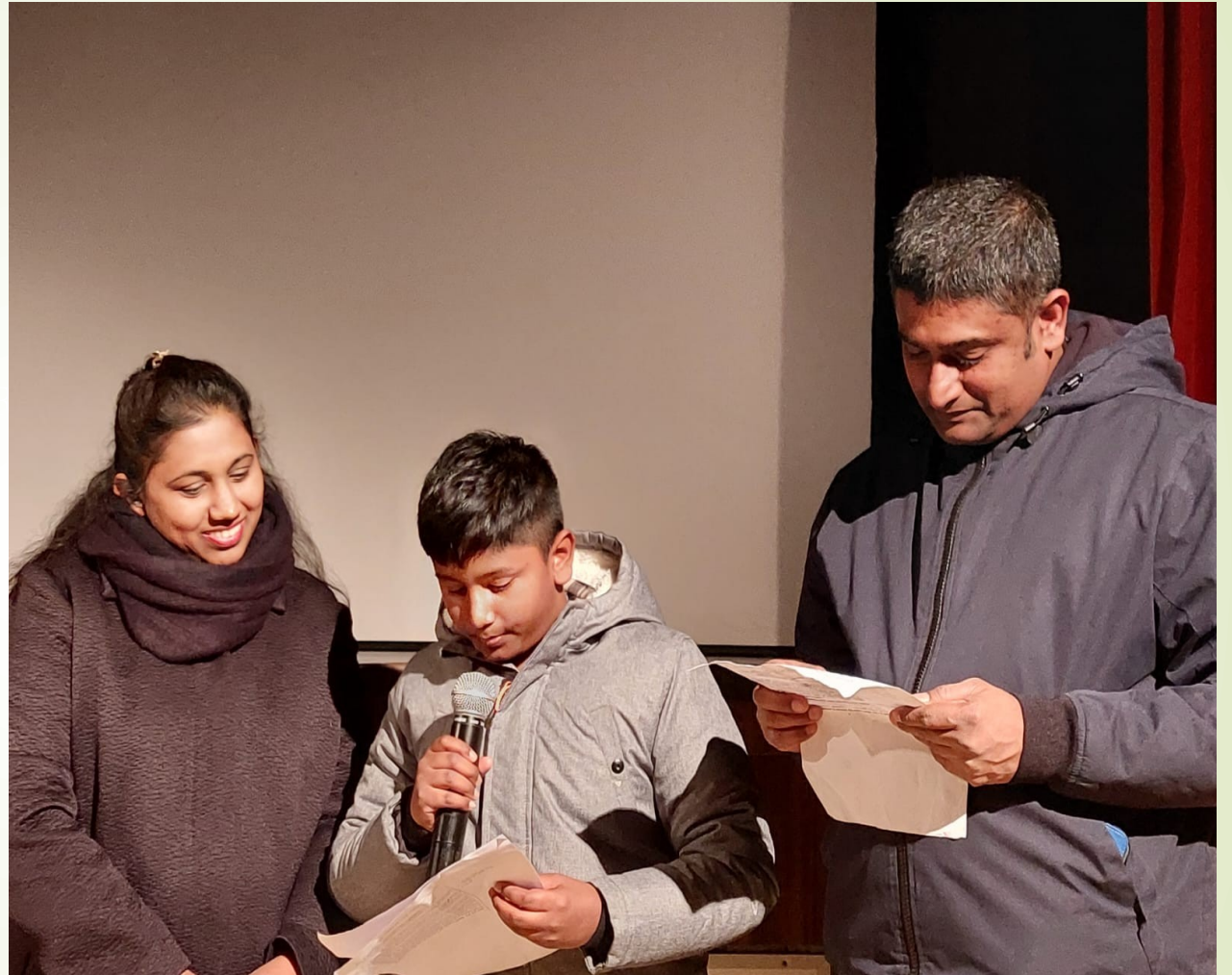
Giornata mondiale dei poveri: testimonianza della famiglia dello Sri Lanka

Le “altre famiglie” (irregolari, straniere...): desiderio/necessità di coinvolgerle, accoglierle