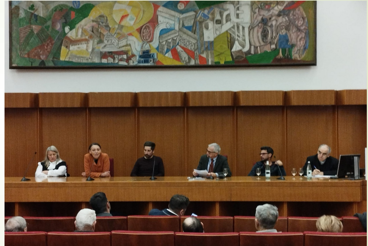
Dialogo con gli imprenditori agricoli