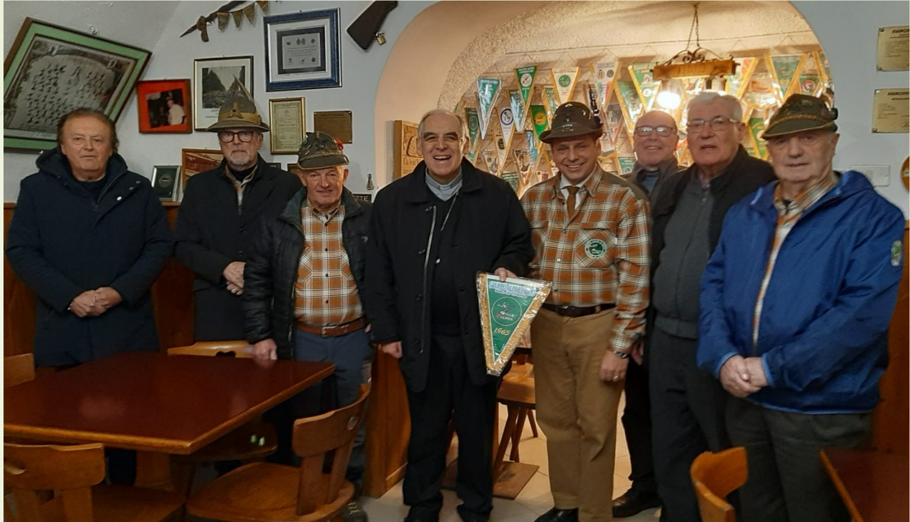
Con gli Alpini di Faedo