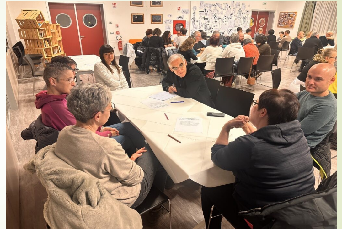
Work caffè con gli operatori del settore turistico