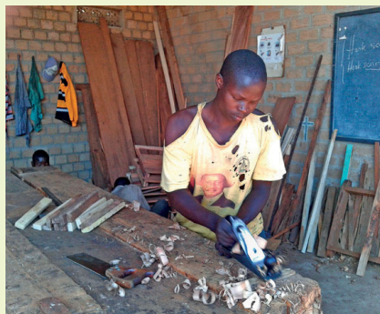
Un artigiano in Uganda

Le rotte marittime verso le coste europee hanno ricevuto la massima attenzione e controllo. Frontex, la pattuglia di frontiera dell'Unione Europea (UE), ha accumulato dati sugli attraversamenti di frontiera intercettati (AFI) dal 2009. Negli ultimi 15