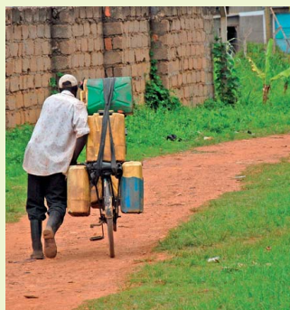
Il problema della siccità a causa dei cambiamenti climatici