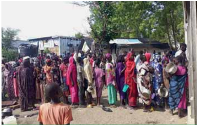
Sudsudanesi in fila per ricevere beni alimentari di prima necessità

T ra le varie crisi umanitarie che il mondo si trova ad affrontare ai nostri giorni, ce n'è una che secondo le stime dell'Agenzia dell'ONU per i rifugiati è la più grave di tutte, conseguenza della feroce guerra che si sta combattendo in Sudan, guerra "minore", per lo più dimenticata. Da due anni ormai questo Paese è dilaniato da combattimenti per la lotta per il potere (e per le ricchezze) tra due generali che avrebbero invece dovuto condurre il Sudan in una transizione verso la democrazia, tanto desiderata dal popolo e per la quale milioni di giovani avevano manifestato e si erano impegnati negli anni precedenti, rischiando la vita sotto il regime del famigerato Omar El Bashir. Decine di migliaia di morti e dodici milioni e mezzo di persone sono state costrette ad abbandonare le proprie case, iniziando una dura lotta per la sopravvivenza, cercando rifugio in campi di protezione all'interno del Paese oppure oltre il confine, specialmente in Ciad e Sud Sudan.