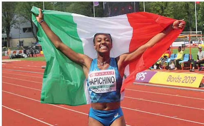
Larissa Iapichino, campionessa di salto in lungo, vittima di uno "scivolone" del Corriere della Sera : "Bellezza selvaggia addomesticata dai cromosomi caucasici del papà"

Essere di parola, prendere in parola, dare la propria parola... sono locuzioni di uso comune, tutti ne conosciamo il significato. A guardar bene esprimono un contenuto profondo: dimostrano quanto potere abbiano le parole. In passato, la parola data equivaleva alla firma di un contratto. Tutt'oggi nel contesto delle religioni africane, in ambienti in cui è preminente la tradizione orale: la parola detta ha un preciso significato e precise conseguenze. Chi lancia una maledizione ad esempio può revocarla oppure può annullarne gli effetti attraverso una benedizione. Esistono molti riti volti a offrire perdono, promuovere la riconciliazione e garantire l'armonia tra gli individui e all'interno delle comunità (Nigrizia 3/21). Eppure, l'imbarbarimento del linguaggio pubblico, gli sfoghi sui social, vigliaccamente espressi dall'anonimato digitale, il cosiddetto hate speech, il linguaggio dell'odio sono entrati a far parte del nostro panorama mediatico (Nigrizia 4/21). Così l'uso improprio delle parole prende sfumature razziste anche in frasi apparentemente innocenti. Come nel caso di Larissa Iapichino