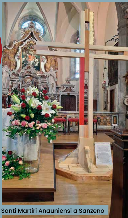
La Basilica dei Santi Martiri Anauniensi a Sanzeno