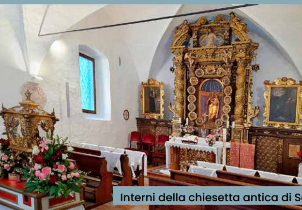
Interni della chiesetta antica di Sanzeno e Santuario di San Romedio