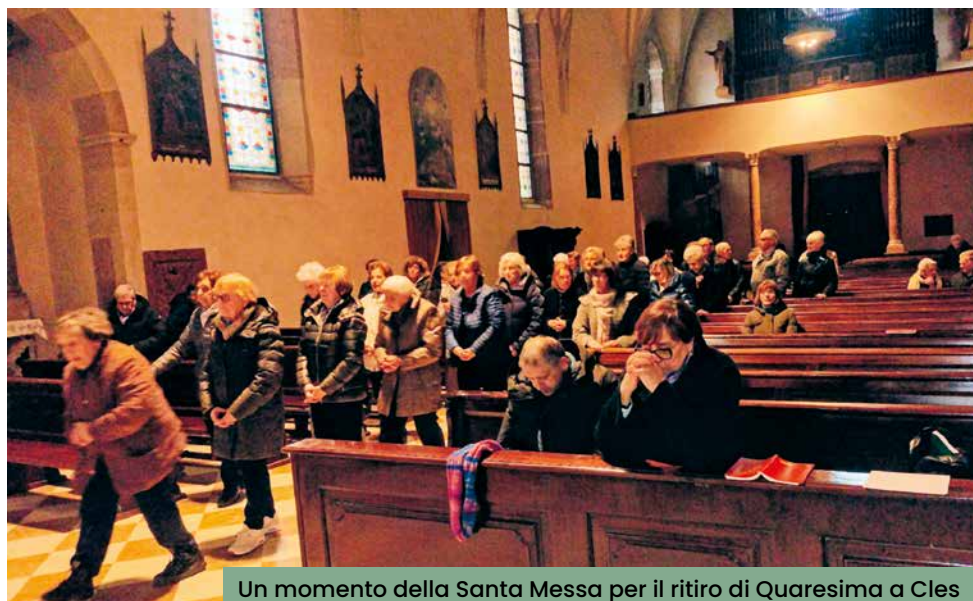
Un momento della Santa Messa per il ritiro di Quaresima a Cles

Ci spostiamo a piedi sotto l'ombrello fino alla pizzeria dove cordialmente ci scambiamo notizie per circa due ore, gustando quanto di buono ci viene servito e infine ritorniamo soddisfatti alle nostre case.