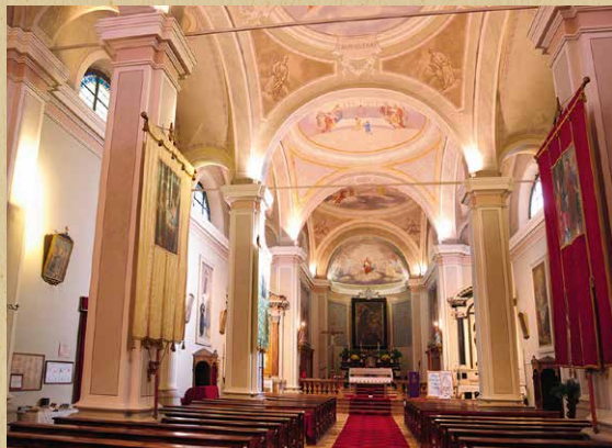
Chiesa di S. Bartolomeo Capriana