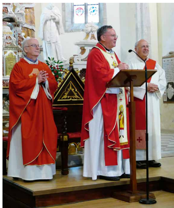
Sanzeno, 29 maggio 2019. Immagini della giornata conclusiva dell'Anno Pastorale 2018-2019.