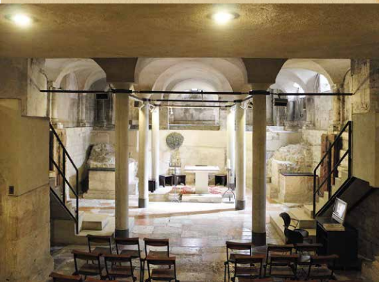
Cattedrale di San Vigilio - Cripta

Anno Pastorale Ottobre 2019 | Maggio 2020